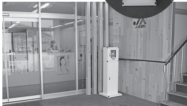
農協事務所正面入り口に設置