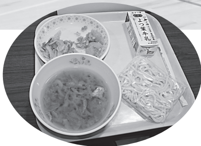
清里食材を使った特別メニュー