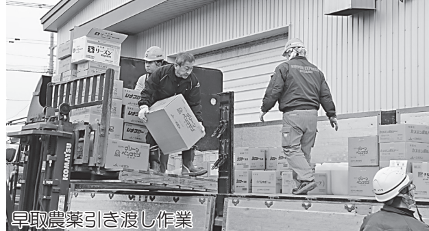
早取農薬引き渡し作業